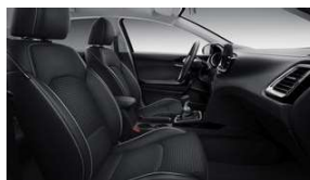
Melns sēdekļu auduma apdare kombinācijā ar ādas imitāciju